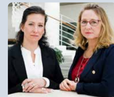
"Vänsterpartiets krav är tydligt. – Ta bort sparkraven på folkhögskolorna."

Vänsterpartiets krav är tydligt. – Ta bort sparkraven på folkhögskolorna.